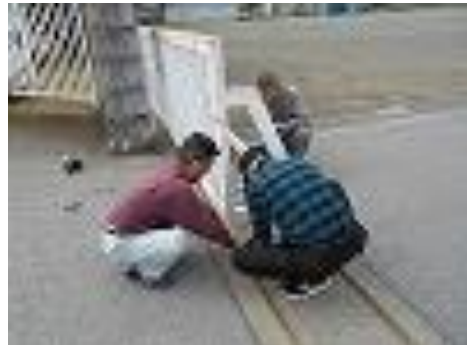
不具合のあった正門の門扉をご近所の方が修理してくださいました。ありがとうございました。