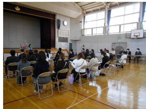
PTA 総会:渡瀬小最後の PTA 総会でした。大勢の方のご参加ありがとうございました。