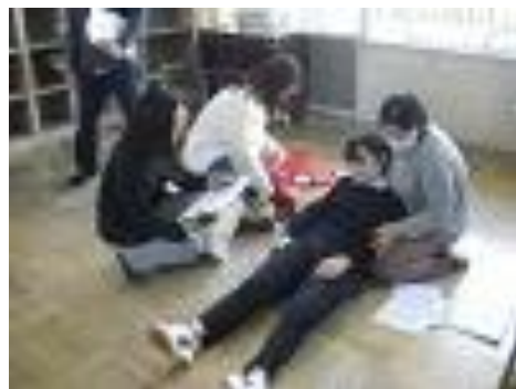
エピペン研修:食物アレルギーの児童に対応するためのシミュレーション研修を始業式前に実施しました。