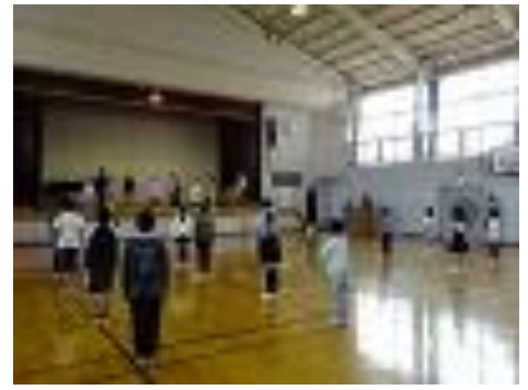
対面式:1年生は一人一人立派な挨拶ができました。